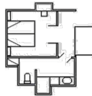
Type C (30 M2)

Le prix ne comprend pas le vol, ni le transfert de l'aéroport à l'hôtel.